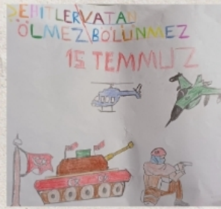
MEHMET BAYRAM -6/A